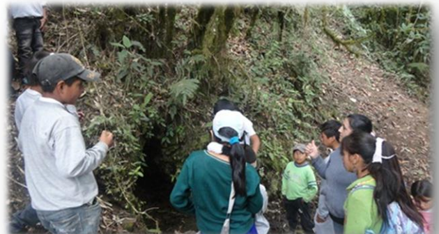
Niños formando parte de la gestión comunitaria del agua

El Centro de Apoyo a la gestión rural del agua potable (CENAGRAP) es una alianza público comunitaria del cantón Cañar que junta a la Municipalidad del cantón con 95 Juntas administradoras de agua potable rurales (JAAPs), su accionar busca la sostenibilidad de las JAAPs, brindando apoyo y servicios para la gestión integral del agua potable y saneamiento en la zona rural.